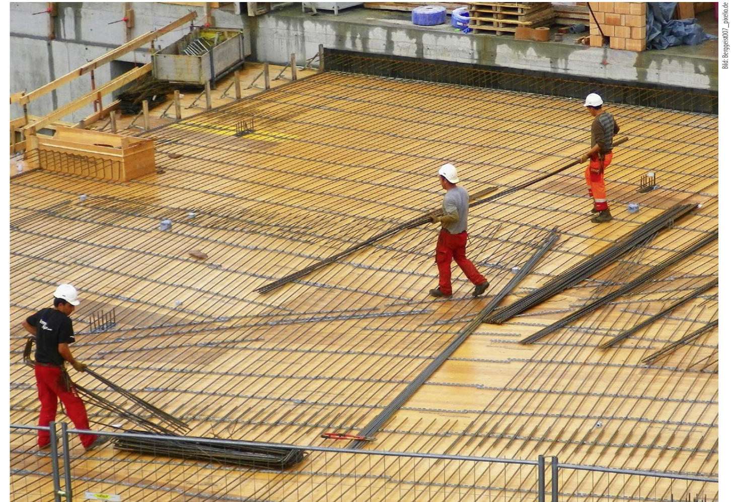
Im Januar erwarteten 38 Prozent der Bauunternehmen, dass ihre Preise in den kommenden drei Monaten steigen werden.

Auch die Geschäftslage der Bauunternehmen ist gemäss den Ergebnissen KOF Konjunkturumfragen gegenwärtig vorteilhaft. Nach einer Abkühlung der Dynamik im Verlaufe des vergangenen Jahres gewinnen die Indikatoren für die Geschäftslage, die Nachfrage, die Auftragsbestände und