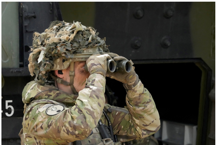
Ein Mitglied der dänischen Armee während der NATO-Übung «Summer Shield» im Mai 2022 in Lettland.

Auf dem Gipfeltreffen im Juni 2022 in Madrid wird die NATO ein neues strategisches Konzept verabschiedet, das ihre Ausrichtung bis 2030 und darüber hinaus festlegt. Im Zentrum dieser Strategie wird die kollektive Verteidigung stehen, wobei die NATO auch überlegen muss, wie sie mit dem Aufstieg Chinas und der anhaltenden Instabilität an ihrer südlichen Peripherie umgehen soll. Die NATO wird ein