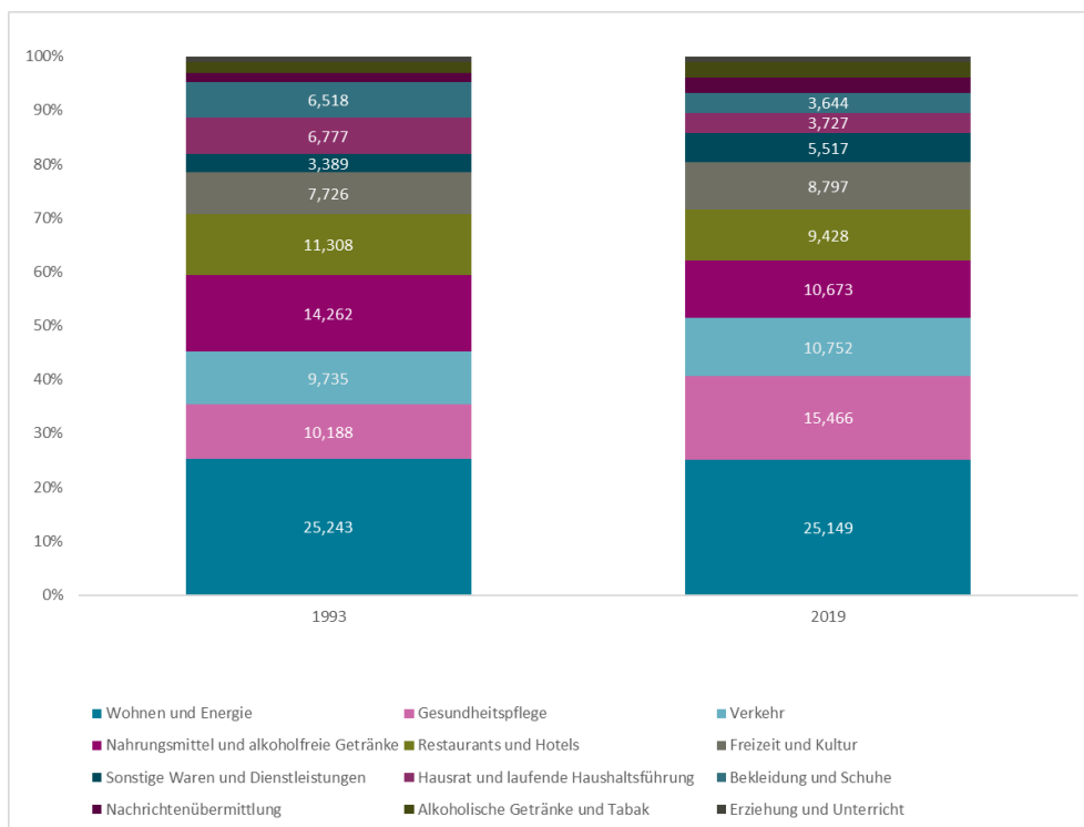
Abbildung 3: Die Verschiebung der Warenkorbstruktur des LIKs

Der Gesundheitssektor entwickelt sich zu einem immer wichtigeren Zweig der Schweizer Wirtschaft. Im Jahr 2017 waren im Gesundheitswesen 281'000 Personen, gerechnet in Vollzeitäquivalenten, tätig. Der Anteil der Beschäftigten im Gesundheitswesen an der Gesamtbeschäftigung nimmt langfristig betrachtet zu. Er erhöhte sich, gemessen in Vollzeitäquivalenten, von 4.8% im Jahr 1992 auf 7.3% im Jahr 2017. Der Anteil des Gesundheitswesens an der gesamten Wertschöpfung stieg von 3.9% (1997) auf 5.4% (2016).