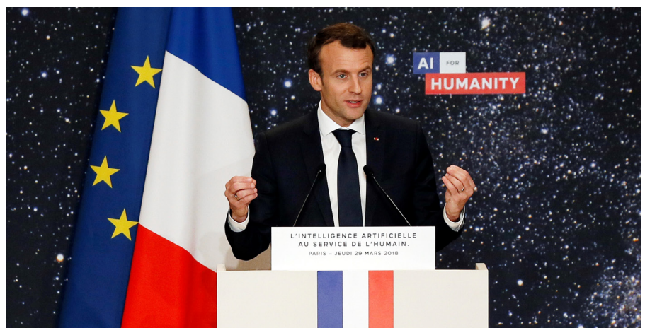
Der französische Präsident, Emmanuel Macron, stellt am 29. März 2018 an einer Veranstaltung in Paris die französische KI-Strategie vor.

Die Fortschritte im Bereich der KI sind auch mit Risiken, Umbrüchen und offenen Fragen verbunden. Gesamtgesellschaftlich betrachtet gehören dazu unter anderem die Umwälzung des Arbeitsmarktes und die damit verbundenen soziökonomischen Implikationen, der Zugang sowie Umgang mit Daten und damit verbundene Fragen des Datenschutzes sowie grundlegende ethische Fragen, zum Beispiel bezüglich der Transparenz und der Nachvollziehbarkeit. Im Bereich der Sicherheits- und Aussenpolitik stellen sich unter anderem Fragen bezüglich der globalen Ungleichheit. So könnte KI das militärische und wirtschaftliche Gefälle zwischen den wirtschaftsstär-