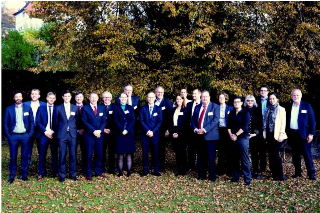
Abbildung 9: Die Teilnehmer des internationalen Experten-Workshops in Zürich

meistern und entsprechend können allein auf frühere Erfahrungen reagierende Instrumente eventuell ungeeignet sein. In der Organisationsforschung spricht man in solchen Fällen von «overlearning», das heisst wenn einzelne Erfahrungen zur unreflektierten Verabschiedung etablierter Prozesse und Strukturen führen. Aus diesem Grund erscheint die Entwicklung von «best practices» auf der Grundlage der Erfahrungen aus der Flüchtlingskrise nur wenig hilfreich. Stattdessen werden flexible Ansätze als erfolgsversprechend gesehen. So sollte verstärkt versucht werden, gemeinsame Arbeitsgrundlagen zu erarbeiten, die dann je nach Kontextbedingungen angepasst werden können. Auf diese Weise kann die Koordination zwischen den Ebenen und Akteuren deutlich vereinfacht werden.