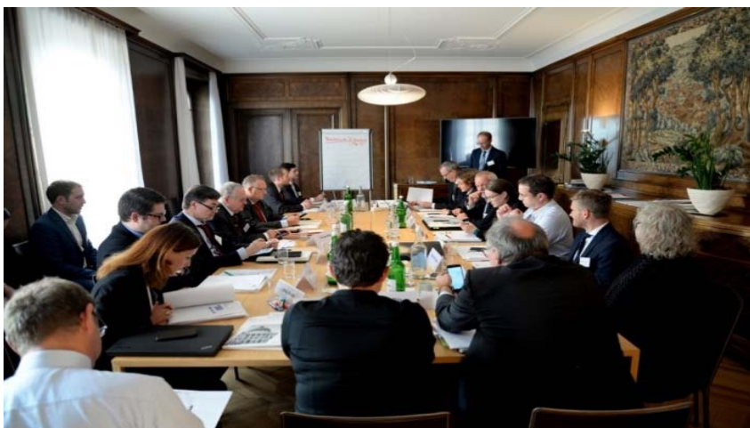
Abbildung 8: Während des Workshops wurde intensiv über die Weiterentwicklung der bestehenden Strukturen diskutiert

Zu beachten bleibt dabei, dass es zum Teil relativ grosse Unterschiede hinsichtlich der jeweiligen nationalen und regionalen Traditionen des zivilgesellschaftlichen Engagements gibt. Daher erscheint die Entwicklung allgemeingültiger Lösungen kaum realistisch. Was die unterschiedlichen Länder jedoch vereint, ist die generell sehr grosse Bereitschaft auf Seiten der Bürger, in Krisensituationen ihre Zeit und Talente, ihr Wissen und Engagement einzubringen. Wie sich während der Flüchtlingskrise gezeigt hat, ist es auch vielen Migranten selbst ein grosses Bedürfnis einen Beitrag zum Gemeinwohl zu leisten. Vorderstes Ziel für Behörden muss entsprechend sein, die Menschen zu befähigen, sich einzubringen, um so ihren Nachbarn, Familien und Freunden zu helfen. Eine Möglichkeit hierfür können z.B. lokale Freiwilligenagenturen sein, wie sie sich vielerorts in Deutschland bewährt haben. Zudem sollten die Behörden darauf achten, dass ehrenamtliches Engagement nicht durch bürokratische Hürden unnötig erschwert wird. Wie es ein Workshop-Teilnehmer formulierte: «Man muss Freiwillige nicht motivieren, man darf sie nur nicht demotivieren». Zugleich ist im Zuge der Förderung von freiwilligen Engagement der Eindruck zu vermeiden, der Staat ziehe sich zurück. Vielmehr ist ein partnerschaftliches Verhältnis zwischen den Akteursgruppen anzustreben.