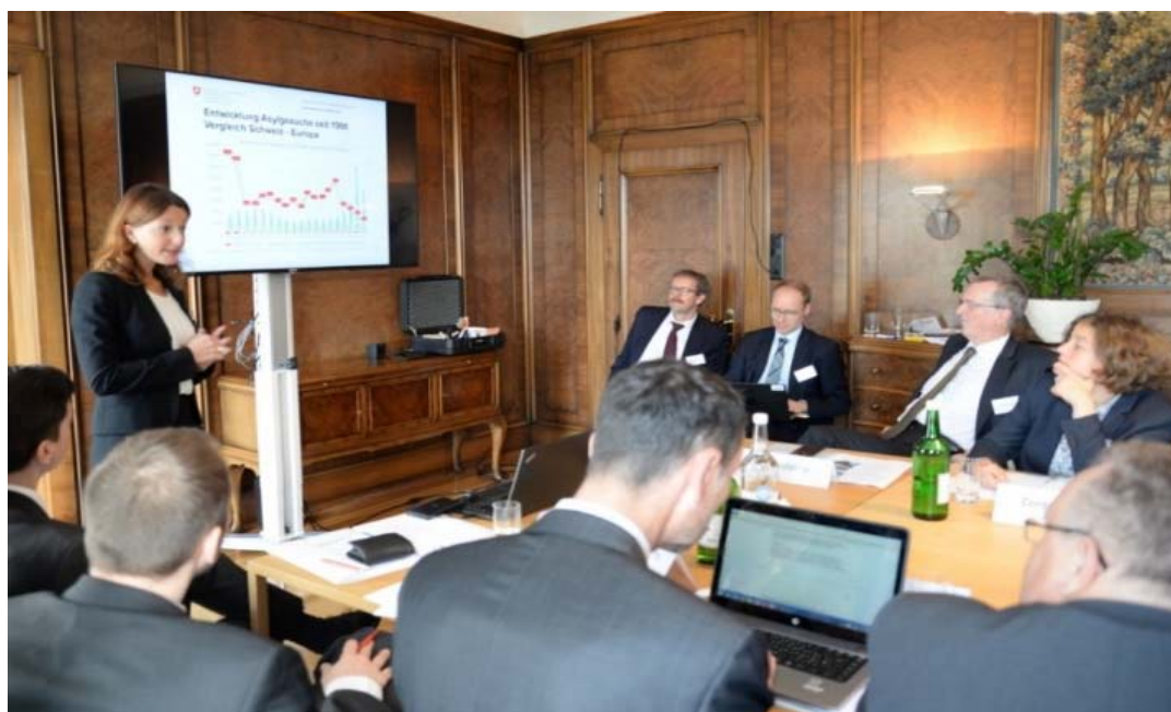
Abbildung 2: Referenten aus Deutschland, Österreich und der Schweiz lieferten Einblicke in die Praxis in den jeweiligen Ländern

Zum Zweck der Koordination dieser Akteure wurde im Juli 2015 ein Migrationsstab gebildet, zwei Monate später wurde ein weiterer, insbesondere polizeilich geprägter Stab etabliert. Diese Gremien hatten in erster Linie eine koordinierende Funktion, während die Hauptarbeit des operativen Krisenmanagements in den betroffenen Bundes- und Landesbehörden stattfand. Im Bereich Transport übernahmen die Österreichische Bundesbahnen und die österreichischen Busunternehmen eine wichtige Funktion, die sich dabei als effektiv und anpassungsfähig erwiesen. Unklar war zunächst die Frage, wie die Finanzierung der eingeleiteten Massnahmen zwischen Bund und Ländern aufgeteilt werden kann. Erschwert wurde die Lösungsfindung dabei durch eine ausgeprägte Polarisierung in der österreichischen Asyl- und Migrationspolitik, wobei in der Debatte sowohl auf politischer wie auch auf Verwaltungsebene die bestehenden bzw. für Maßnahmensetzungen herangezogenen Kompetenzbereiche nicht immer mit der Bereitschaft einer damit einher gehenden Finanzierung