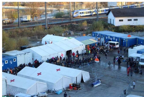
Abbildung 6: Zeltaufbau in Kufstein/Österreich im Herbst 2015

Als eine besondere Herausforderung stellte sich zudem die Betreuung unbegleiteter minderjähriger Flüchtlinge (UMF) dar. Stand Oktober 2016 betreute das Bundesland Tirol zirka 290 UMF. Diese Personengruppe stellte sich als ausserordentlich betreuungsintensiv heraus, unter anderem kam es immer wieder zu Schwierigkeiten bei der Identitätsfeststellung sowie bei der notwendigen psychologischen Betreuung.