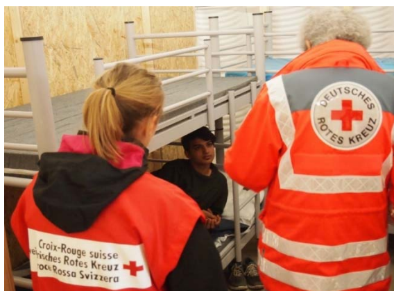
Abbildung 7: Zusammenarbeit von deutschen und schweizerischen Rotkreuz-Mitarbeitern in Erding/Deutschland.

Zu den Hauptaufgaben des SRK zählte die Unterbringung und Verpflegung der Flüchtlinge, deren medizinische Begleitung sowie Animationsaktivitäten. Bis zum Ende des Einsatzes Ende Januar 2016 betreuten die rund 130 Freiwilligen knapp 1'900 Flüchtlinge. Auf Grundlage der in Erding und Buchs gemachten Erfahrungen wäre für die Zukunft vor allem anzustreben, flexiblere Strukturen aufzubauen, die geeignet sind, auf hochdynamische und unsichere Situationen schnell zu reagieren. Zudem wäre das interne Krisenmanagement langfristig zu stärken, um die Gesamtkoordination zu verbessern. Schliesslich sind neue Ansätze zu entwickeln, wie spontane Freiwillige gewinnbringend eingebunden werden können.