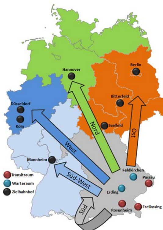
Abbildung 5: Struktur Transport in Verteilbereiche in Deutschland

Der Aufbau der KoST FV war mit zahlreichen Herausforderungen verbunden. Eine der Hauptschwierigkeiten stellte dabei das Fehlen eines strategischen Konzepts dar, mit dessen Hilfe die Arbeit der KoST FV geplant und initiiert hätte werden können. Tatsächlich musste die KoST FV nahezu ohne jede Vorbereitungszeit ihre Arbeit aufnehmen. Hinzu kam, dass die Koordinierungsstelle über keinen eigenen Personalstamm verfügte, sondern auf Abordnungen unterschiedlicher anderer Behörden angewiesen war, wodurch es zeitweise zu einer hohen Personalfuktuation kam. Ziel für die Zukunft müsse entsprechend sein, die bisherigen Bemühungen weiterzuentwickeln und zu verstetigen. Wichtige Erfahrungen müssten konserviert werden. Langfristig wäre der Aufbau eines anpassungsfähigen Systems notwendig, das flexibel auf dynamische Herausforderungen reagieren und in Krisensituationen schnell zusätzliche Kapazitäten schaffen kann.