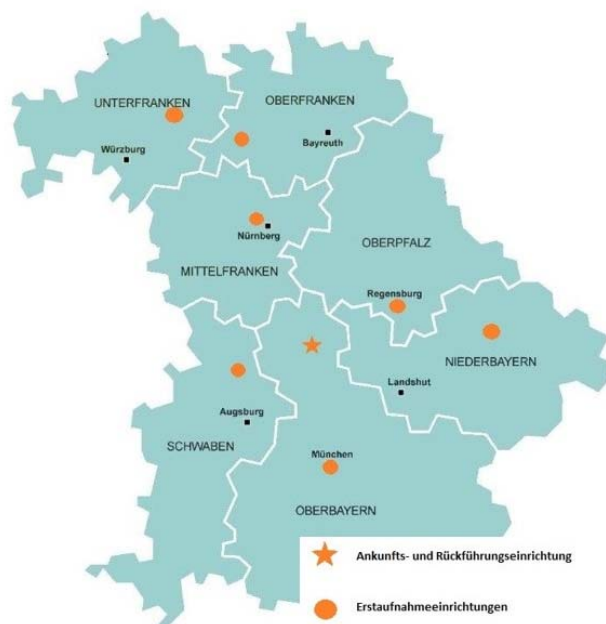
Abbildung 4: Übersicht Erstaufnahmeeinrichtungen (inkl. ARE) in Bayern

Bayerns Kommunalverantwortliche waren im Herbst 2015 an die Grenzen ihrer realen Belastbarkeit gebracht worden. Nachdem Mitte September die Bundesregierung entschieden hatte, Drittstaatsangehörigen ohne aufenthaltslegitimierende Dokumente und mit Vorbringen eines Asylbegehrens die Einreise zu gestatten kamen nicht selten 5'000 bis 8'000 Flüchtlinge täglich im Süden Bayerns an. Bayern hatte bereits ein Jahr zuvor, im Herbst 2014 damit begonnen systematisch für seinen länderspezifischen Zuständigkeitsbereich die bestehenden Kapazitäten deutlich von ca. 12'000 auf ca. 40'000 Plätze zu erhöhen und in den sieben Regierungsbezirken verbindliche Aufnahmekapazitäten und komplementäre Notkapazitäten für die Erstaufnahme und Unterbringung von Flüchtlingen/Asylbewerbern zu schaffen (s. Abbildung 4).