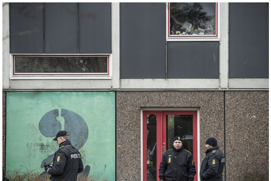
Die dänische Polizei durchsucht am 7.4.2016 einen Wohnblock in Ishøj bei Kopenhagen. Vier Personen werden verdächtigt, im Auftrag des IS Terroranschläge in Dänemark zu planen.

Inzwischen sind in den meisten europäischen Ländern Gesetze vorhanden, die den